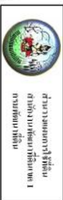
รูปที่ 3-3 แผนที่ผลการใช้ที่ดิน ตำบลห้วยกระษेत्र อำเภอจันทบุรี จังหวัดจันทบุรี